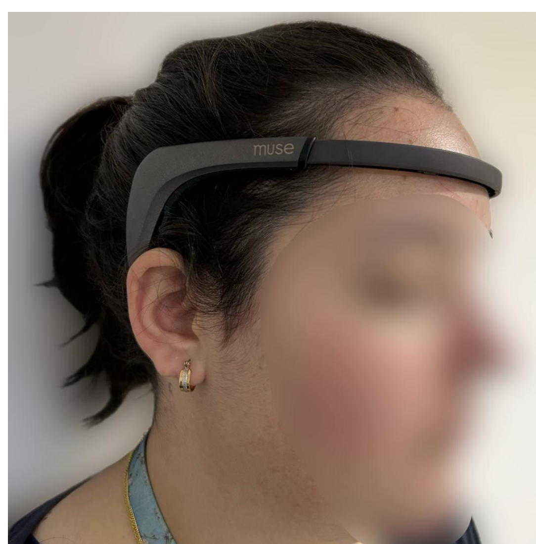
Figura 1 - Voluntária demonstrando a utilização do equipamento MUSE.

Estudo observacional e analítico aprovado pelo Comitê de Ética em Pesquisa. Foram registradas as ondas cerebrais através do dispositivo eletroencefalógrafo (MUSE, InteraXon, Toronto, Canada). Foram abordados três diferentes protocolos, de 15 minutos, a fim de estabelecer a melhor maneira de deixar os voluntários em um relaxamento basal. Os protocolos consistem: protocolo um - baixa luminosidade, ruído branco de escolha individual; protocolo dois - alta luminosidade, ruído branco de escolha individual; protocolo três - alta luminosidade, ausência de ruído branco. Os dados coletados foram processados utilizando o aplicativo Mind Monitor e analisados no Origin (v. 8.5, OriginLab Corp., MA, USA). Para a avaliação estatística foi utilizado o programa InStat (v. 3.00, GraphPad, Harvey Motulsky). Inicialmente foi realizada a Análise de Variância (ANOVA), caso o resultado apresentasse significância, os dados foram avaliados quanto a normalidade utilizando o teste de Kolmogorov-Smirnov, para dados não paramétricos foi utilizado o teste post-roc de múltiplas comparações de Dunn. Foi considerado um nível de significância de 5% para indicar diferença entre protocolos.