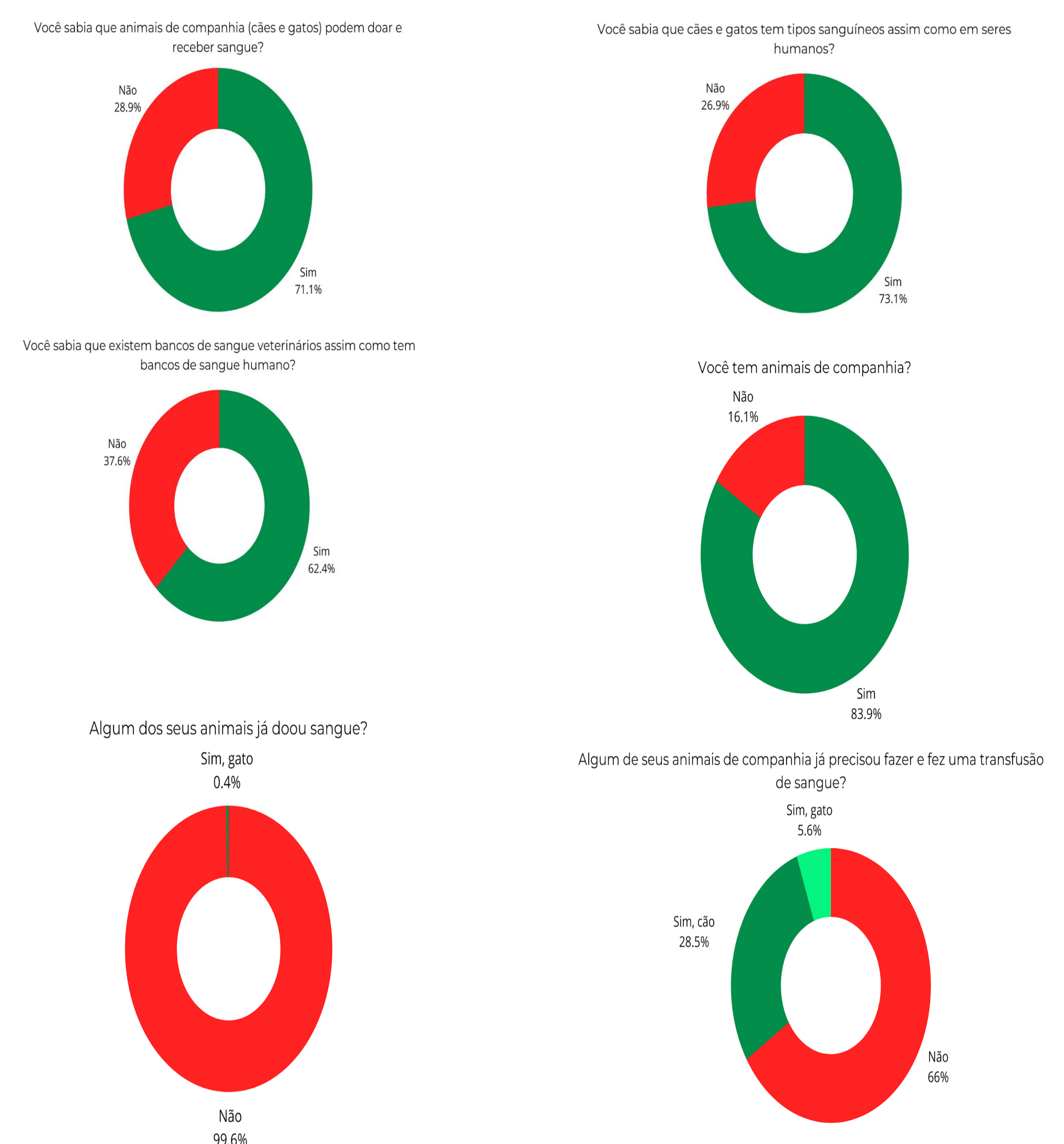
Figura 1 - Respostas dos entrevistados referente ao questionário sobre transfusão de sangue em animais de companhia

Foram obtidas 242 respostas para o questionário sobre transfusão de sangue em animais de companhia, a partir dos dados obtidos foram gerados gráficos de porcentagem, figuras 1. Através das ferramentas digitais utilizadas e o compartilhamento feito por meio dela, captou 54 possíveis doadores felinos e 41 caninos.