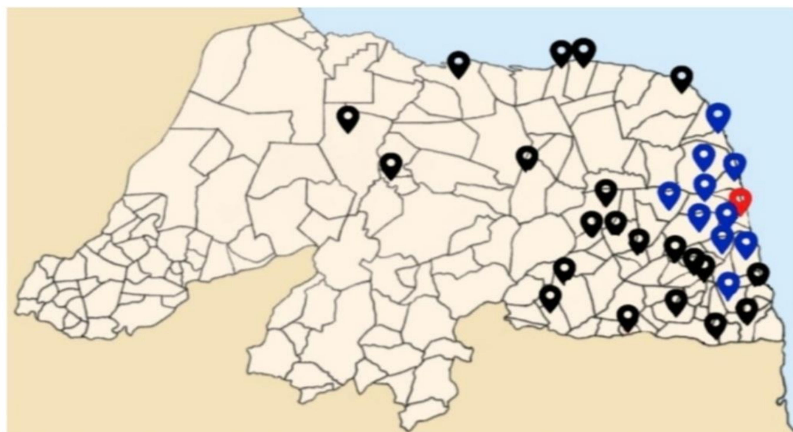
Figura 1 - Municípios de procedência dos pacientes.

Foram incluídos 135 pacientes com idade média de 52,2 ( \pm 12,8 ) anos, sendo 86% do sexo feminino, procedência de acordo com Figura 1. A aderência ao tratamento na consulta de retorno foi avaliada em 54 pacientes com resultados nas gráficos 1 e 2.